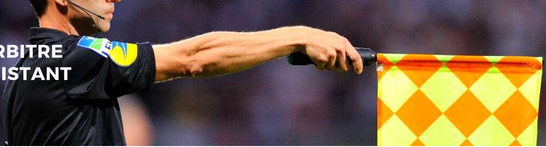
TOUCHE VERS LA DROITE