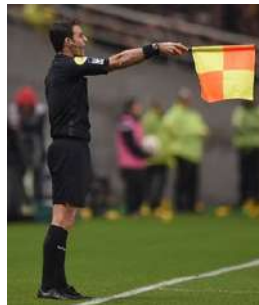
ATTENDRE COUP DE SIFFLET

FAUTE = AGITER DRAPEAU ET INDIQUER LE SENS